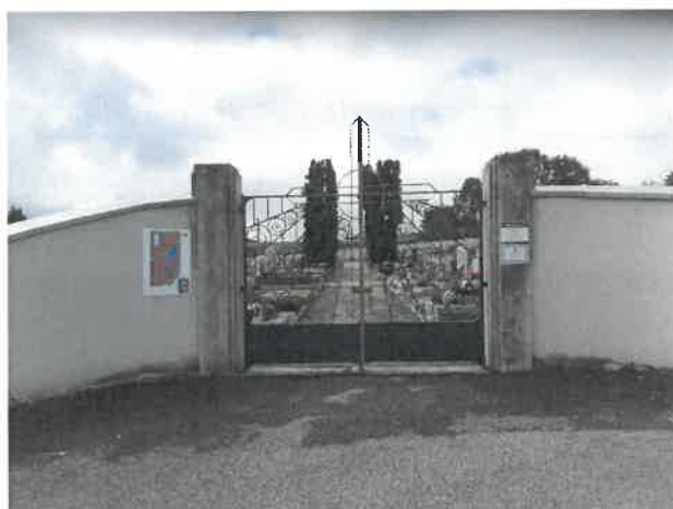
Vue de l'entrée principale du cimetière

Le cimetière de Villaz occupe une surface globale de 3836 m 2 sur la parcelle cadastrale B299 et compte environ 260 emplacements pour l'inhumation et 70 emplacements cinéraires