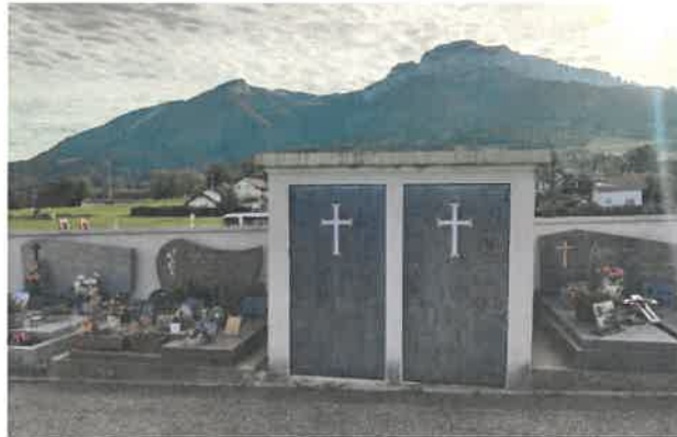
Le dépositoire depuis l'intérieur du cimetière existant

La zone d'agrandissement sera adossée au cimetière existant sans démolition du mur en maçonnerie qui forme sa clôture à l'est, parallèlement à la rue des écoles. Une ouverture de communication sera créée pour assurer une circulation piétonne entre la zone historique et l'agrandissement par transfert du dépositoire existant.