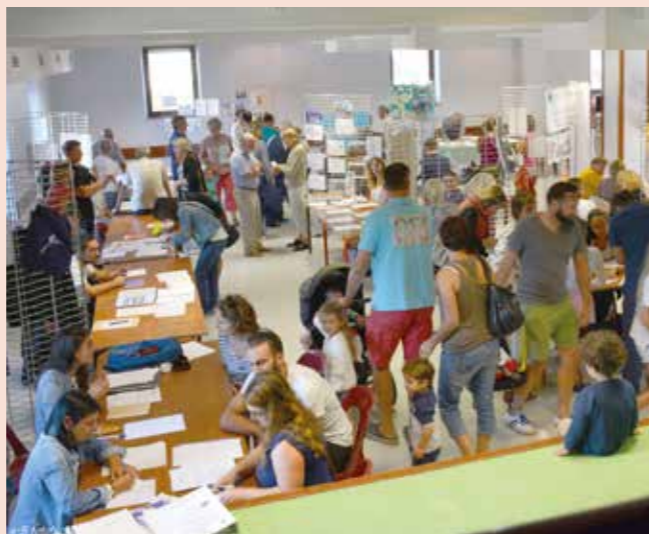
Le forum des associations qui s'est déroulé le 8 septembre, est aussi l'occasion d'accueillir les nouveaux habitants sur la commune.