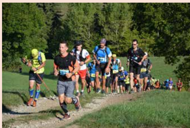
La Villazoise qui a eu le 8 septembre a toujours autant de succès auprès des petits et des grands