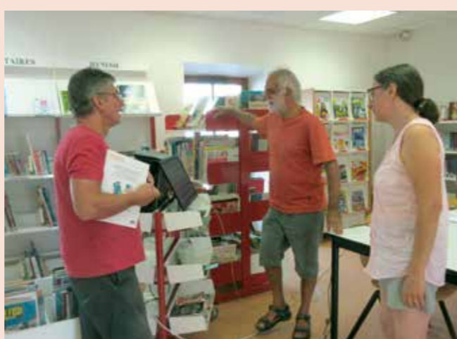
Grand ménage à la bibliothèque pour l'équipe de bénévoles