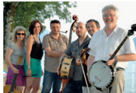
Les Wooden Legs